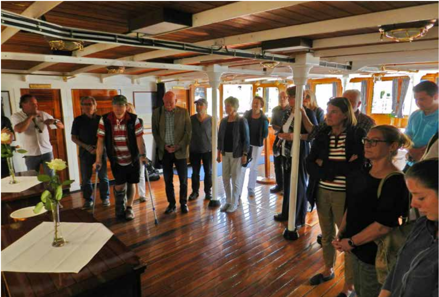
Führung auf der HOHENTWIEL