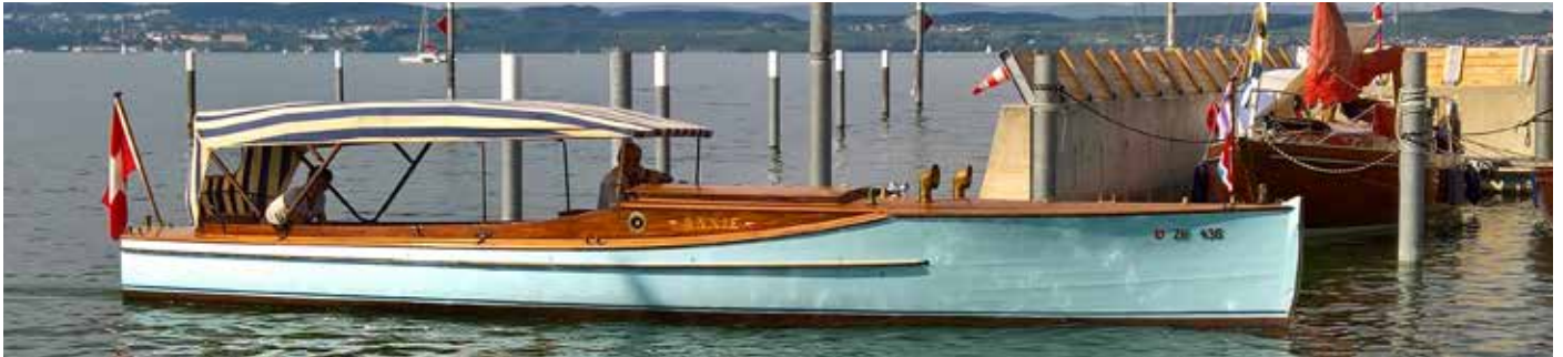
Foto vom Classic Weekende 2016