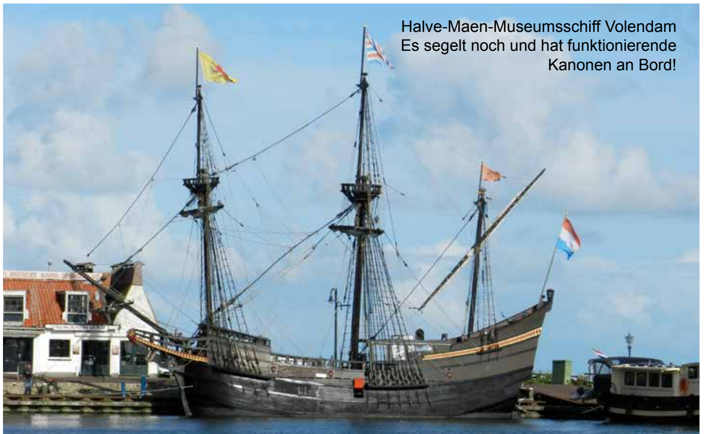
Halve-Maen-Museumsschiff Volendam Es segelt noch und hat funktionierende Kanonen an Bord!