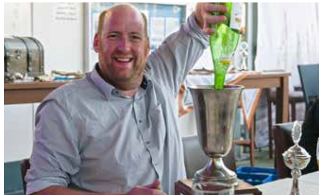
Oldtimerregatta 2021