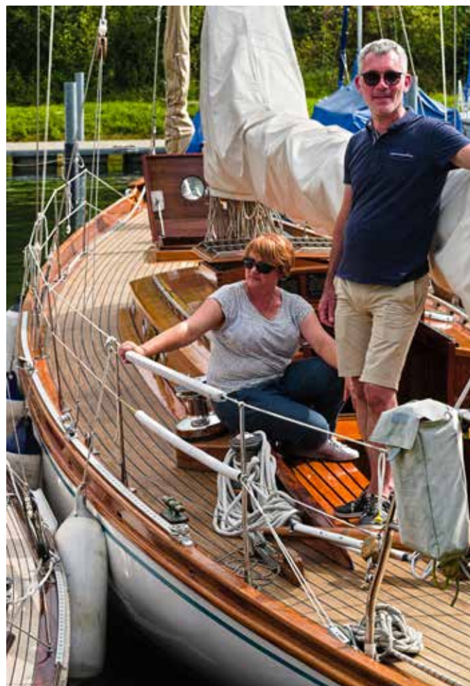
Oldtimerregatta 2021, Foto Norbert Herter

© Fotos und Reproduktionen in dieser Ausgabe: Lukas Pfammatter, (Inserate ausgenommen) Marcus Salomon, Norbert Herter