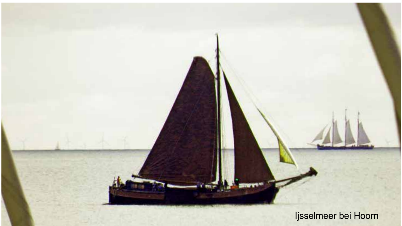
ljsselmeer bei Hoorn