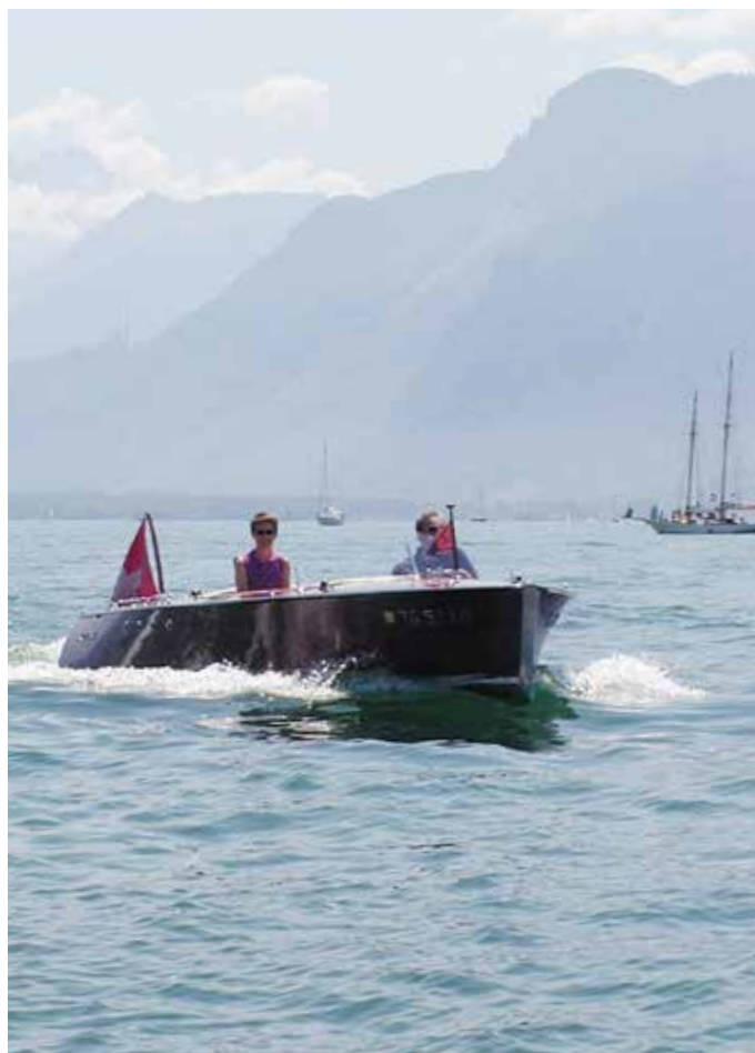
Archivbilder vom Genfersee