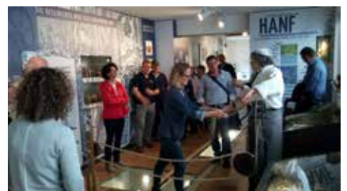
Besuch der Seilerei Muffler