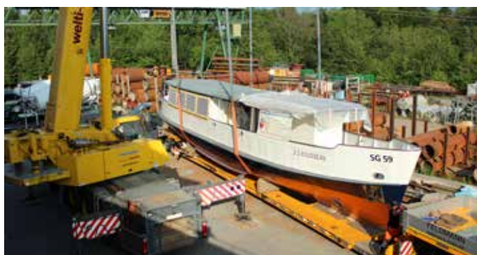
Die Sanierung des MS J.J. Rousseau ist beendet

Das Schiff sollte seinen ursprünglichen Stil und Charakter behalten, für Gäste angenehm und gemütlich wirken und dazu Fahrgäste mit Fahrrad und Kinderwagen von Lachen nach Busskirch und zurück transportieren können. Es erhielt Schlingerkeile, das Bugstrahlruder und die ganze Antriebsanlage sowie die Schale wurden saniert bzw. restauriert. Die Aufbauten sollten so original wie möglich bleiben, der Ursprungszustand des Schiffes durch einen weissen Anstrich neu zur Geltung kommen. Dabei galt, alle Gesetze zu berücksichtigen. Am 7. Juni 2019 war es soweit: MS J.J. Rousseau wurde per Strasse nach Schmerikon gebracht und am Morgen des besagten Tages eingewassert. Nun hatte das Schiff nach 67 Jahren erstmals wieder Zürichseewasser unter dem Kiel. Und es schwamm! Noch am selben Tag wurde MS J.J. Rousseau an seinen neuen Heimatsteg in Schmerikon am Obersee verholt. (Fortsetzung Seite 15)