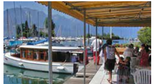
„Sophie Charlotte“ am Genfersee