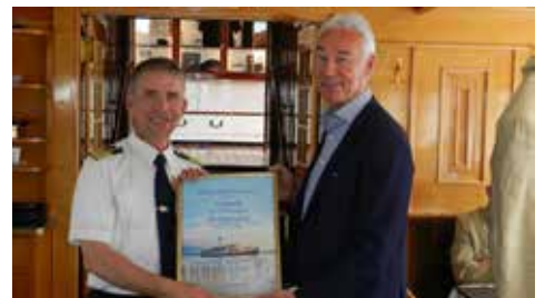
Dampfschiff „HOHENTWIEL“ wird Ehrenmitglied