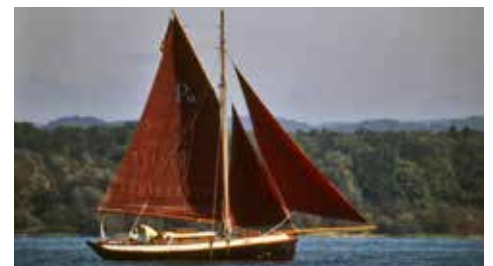
Klaus Kramer auf „LISE VON BUZ“