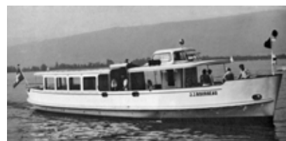
MS J.J. Rousseau historisch auf dem Bielersee

Am 27. Juli lief MS J.J. Rousseau zu ihrer Jungfernfahrt aus. Als «Oberseefähre» können die Eigner die Idee, das charmante Schiff einer breiten Öffentlichkeit zugänglich zu machen, nun realisieren. Aktuelle Informationen: https://ahoi-jjr.ch