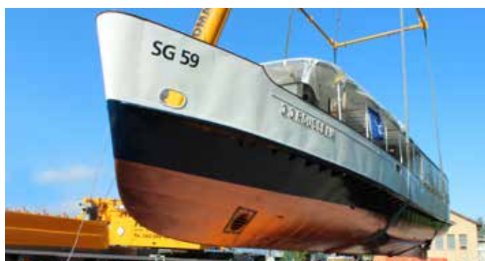
MS J.J. Rousseau auf dem Weg zum Zürichsee