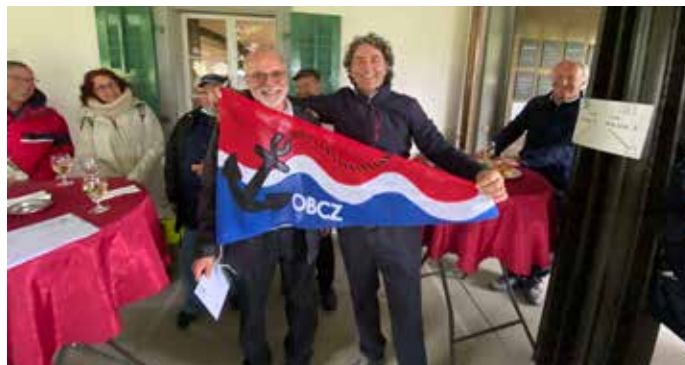
Wimpel für den Eigner MS J.J. Rousseau