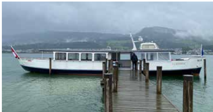
MS J.J. Rousseau schwimmt in neuem Glanz