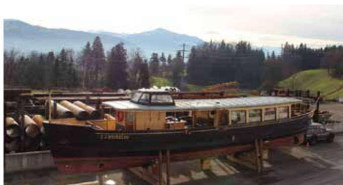
MS J.J. Rousseau auf Land