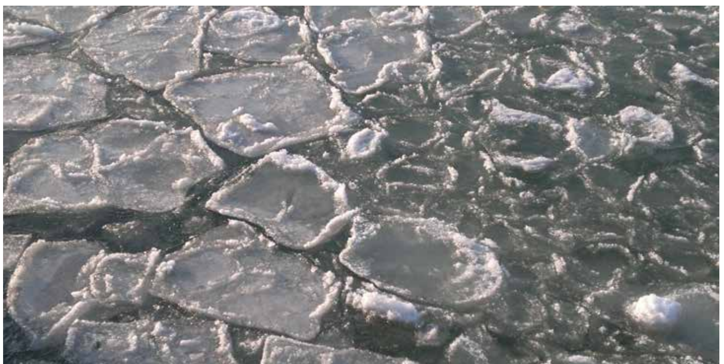
Winterstimmung am Bodensee

*Das Winterlager mit Naturboden eignet sich sehr gut für traditionelle Holzschiffe