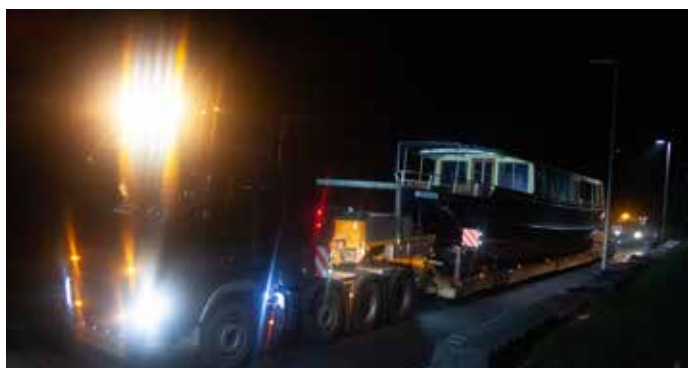
MS J.J. Rousseau von den Niederlanden in die Schweiz

Vom Entscheid das Schiff zu erwerben bis zum Zeitpunkt, an dem es in die Schweiz überführt werden sollte, vergingen nur wenige Wochen und am 9. Dezember 2014 war es soweit: MS J.J. Rousseau kam nachts um ca. 23 Uhr als Spezial-Strassentransport in Baar an – ein erhaben-spannend und emotionaler Moment, der alle Anwesenden erschauern liess. Zwei Tage später und bei Tageslicht stellte sich dann allerdings eine gewisse Ernüchterung ein: Die J.J. Rousseau hatte während ihres Auslandsaufenthaltes mehr an Glanz verloren als angenommen – v.a. der Rumpf bot Grund zu berechtigten Sorgen, wies er doch an vielen Stellen eindeutig Lochfrass auf. Überhaupt wollte sich das Schiff an Land und aufgebockt gar nicht von seiner schmucken Seite zeigen und bald war klar, dass eine reine Pinselrenovation nie genügen würde, es zum dem zu machen wofür es bestimmt war. Dann ruhte die J.J. Rousseau an Land, mehrmals war der Schneidbrenner ein Thema gewesen, bis im Mai 2018 die Restauration beginnen konnte.