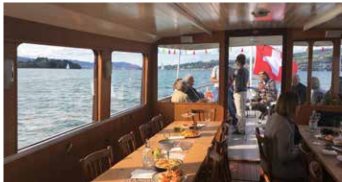
MS J.J. Rousseau, gemütlicher Fahrgastraum