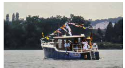
Familie Beuttenmüller auf „AMIRA“