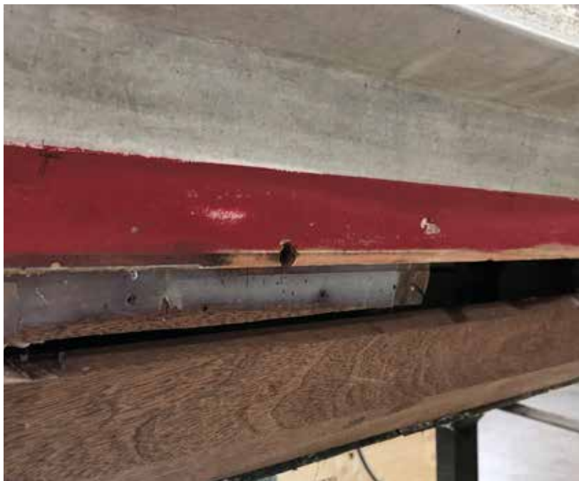
Schäden an der Kimm AJAX