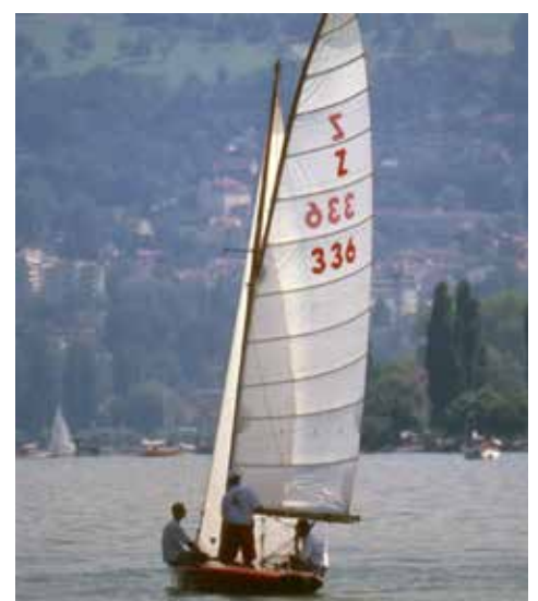
Sammy Smits auf „HEX III“