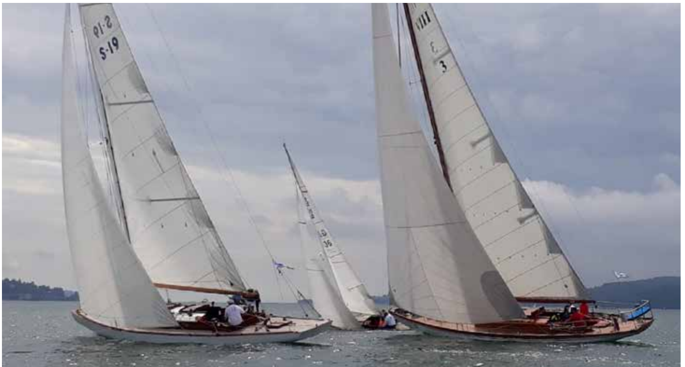
BTW 2019, Foto Andreas Gerber