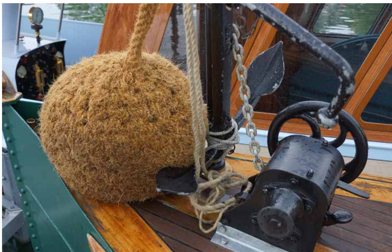
BTW 2019, 4 Dampfboote besuchten uns zu Beginn in Bodman