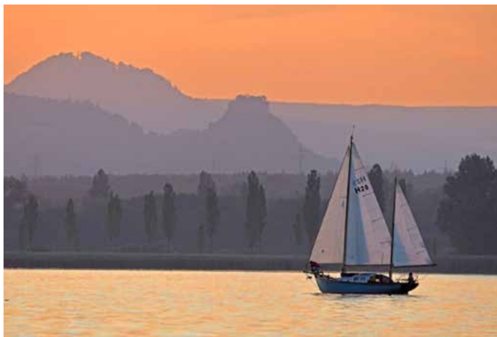
Abendstimmung im Zellersee mit den Hegauvulkanen