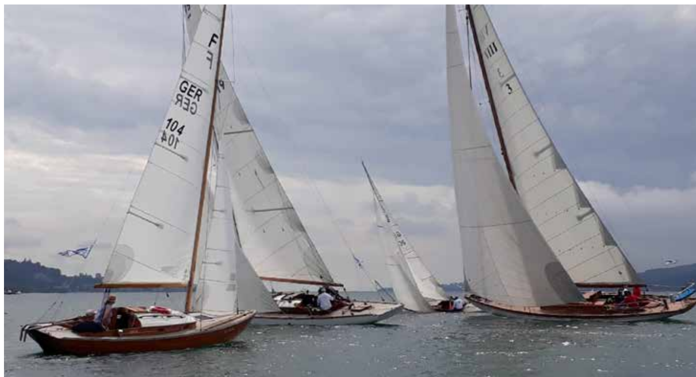
BTW 2019

*Das Winterlager mit Naturboden eignet sich sehr gut für traditionelle Holzschiffe