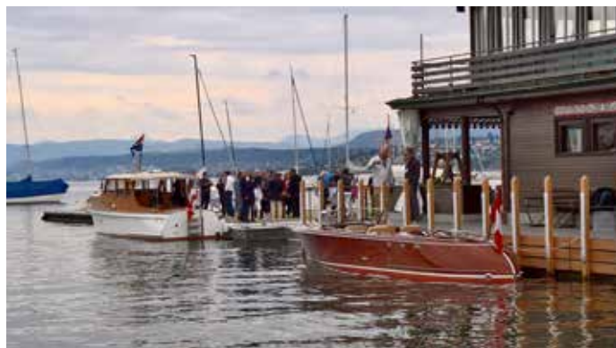
Foto GK links: Flaneur, Foto DH oben und rechts: Festliche Stimmung in Zürich