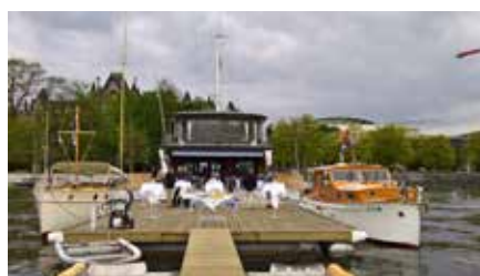
Foto GK oben: Ajax ist bereit Foto GK links: Frösch Foto DH mitte: Gediegener Festplatz in Zürich mitten im Zentrum Foto GK rechts: Mona Lisa