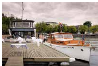
Foto DH links Foto GK oben Foto GK rechts oben: Annie Foto DH rechts unten